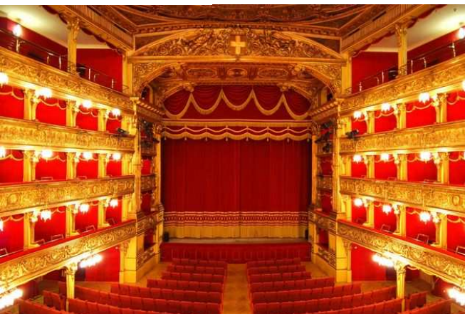
La sala del teatro Carignano